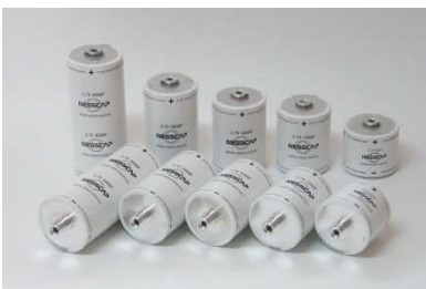
Bild 3 Ultrakondensatoren

Dabei ist es bei weitem nicht so, dass es keine Alternative zu den Akkumulatoren gäbe: Doppelschicht-Kondensatoren, auch als Electronic Double Layer Capacitor (EDLC), Ultrakondensatoren oder Ultracapacitors (Ultracaps) bezeichnet, bewähren sich bereits seit mehreren Jahren als Energiespeicher. Im Unterschied zu den Akkumulatoren speichern Kondensatoren elektrische Energie rein physikalisch, also ohne Umweg über eine chemische Reaktion. Kondensatoren bestehen aus zwei Elektroden und dazwischen dem Dielektrikum als nicht leitender Schicht. Stromfluss durch die Elektroden lädt die eine Elektrode positiv, die andere negativ auf. Die Kapazität der Kondensatoren hängt dabei von der Oberflächengröße der Elektroden und ihrem Abstand zueinander ab. Die Optimierung dieser Faktoren macht aus den Kondensatoren veritable Speicherwunder: Bei Doppelschicht-Kondensatoren werden Kohlenstoff-Elektroden verwendet und anstelle eines Dielektrikums ein Elektrolyt sowie ein Ionen-durchlässiger Isolator. Die Ionen wandern zu den Elektroden und bilden an der Grenze von Kohlenstoff und Elektrolyt eine sehr dünne elektrische Doppelschicht von Ladungsträgern mit hoher Speicherdichte.