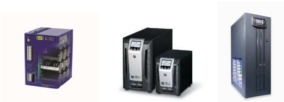
Bild 4 C-TEC offen (DC-USV), Protecto (AC-USV) MLT (3-phasige USV)

Doppelschicht-Kondensatoren nehmen mit Kapazitätswerten von bis zu einigen zehntausend Farad erheblich größere Energiemengen auf als normale Kondensatoren und bringen eine höhere Leistung als Batterien. Sie lassen sich im Vergleich zu Akkumulatoren schneller laden und haben eine deutlich längere Lebensdauer. Als Zellen in handhabbarer Größe und zu akzeptablen Preisen finden sie auch in USV-Geräten Verwendung und sichern dort Anwendungen ab, die kurze Spitzenleistungen zwischen längeren Intervallen mit geringem Energiebedarf benötigen und sehr viele Lade- und Entladevorgänge erforderlich machen. J. Schneider Elektrotechnik beispielsweise setzt Doppelschicht-Kondensatoren in den USV-Anlagen der Baureihe C-TEC . Protecto, MLT ein.